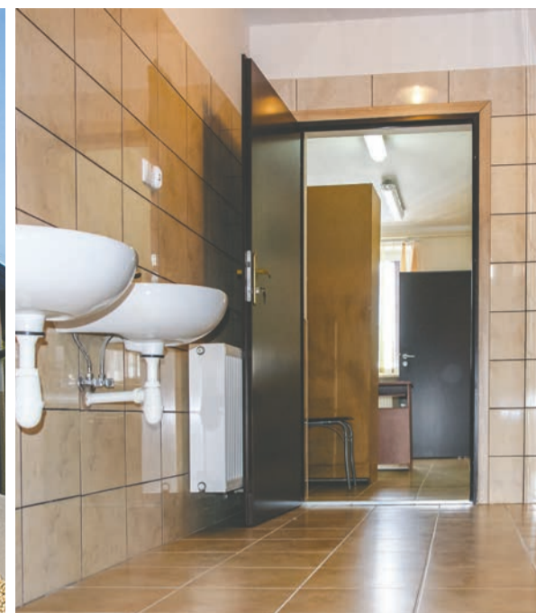
CENTRUM KULTURY I SPORTU W JODŁOWEJ GÓRNEJ (POWYŻEJ) ORAZ SZKOŁA PODSTAWOWA I SALA GIMNASTYCZNA W JODŁOWEJ (PONIŻEJ) PO REMONTACH PREZENTUJĄ SIĘ ZNAKOMICIE