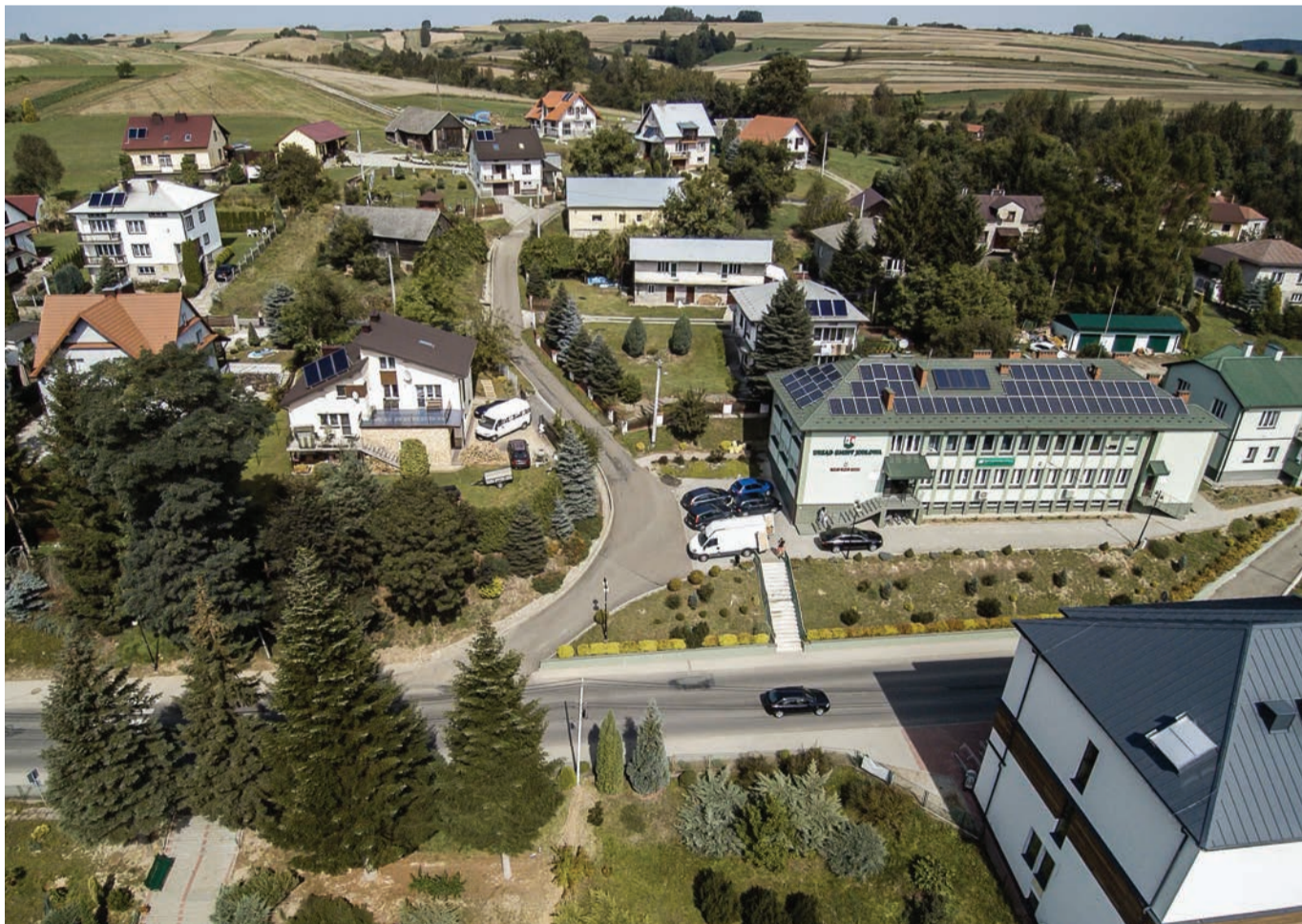
Budynek Urzędu Gminy Jodłowa i okolica z lotu ptaka.

Jak na Wielkanoc deszcz pada, co trzeci kłós w polu przepada